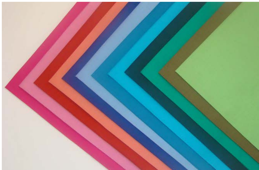
JEU 12 DRAPAGES Méthode 4 saisons 84 € Finition des bords en point de bourdon . 45 X 60 cm