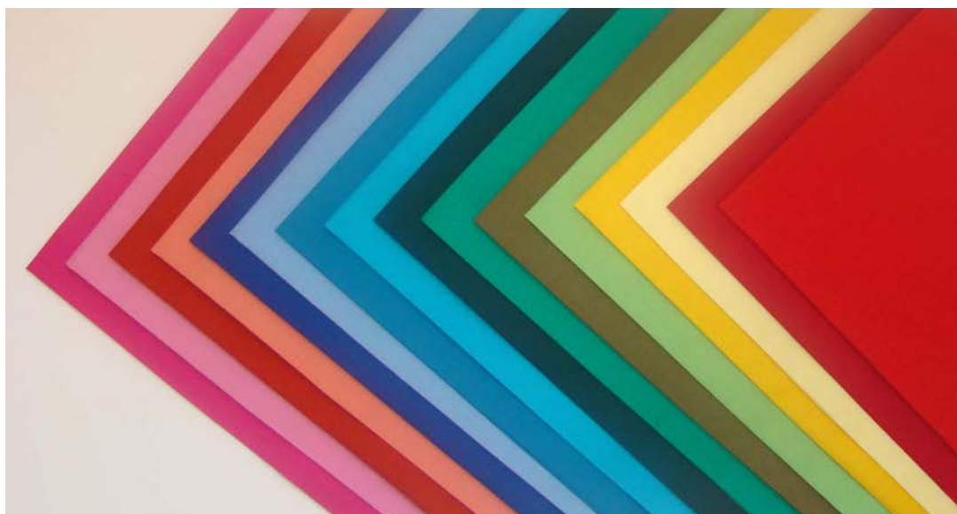
JEU 16 DRAPAGES Méthode 4 saisons 112 € Finition des bords en point de bourdon . 45 X 60 cm

Les drapages peuvent être identifiés par une étiquette indiquant le nom et les caractéristiques colorimétriques des couleurs (cocher la case sur le bon de commande). Possibilité de remplacer certains coloris de drapages correspondant à votre méthodologie